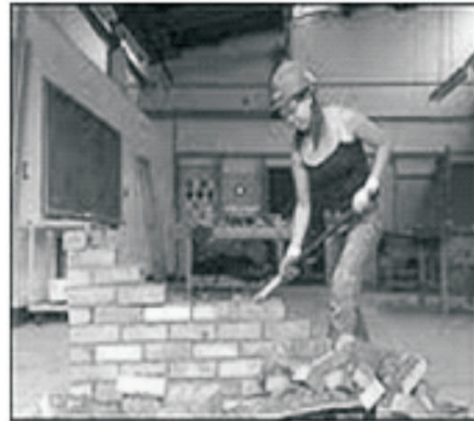
Pàtáki fún àwọn ọdọ ~ 8